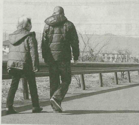
グループホームの近所を散歩する認知症の女性(左、守山市で)

「した」と新たなシステムに期待を寄せる。女性に、買った物を忘れるなどの症状が現れ始めたのは約6年前のことだった。女性の実母が亡くなったことが引き金になったとみられる。その後、電話番号や住所、日付を思い出せなくなるなど、年々症状が重くなり、可愛がっていた孫2人の顔すら分からなくなった。